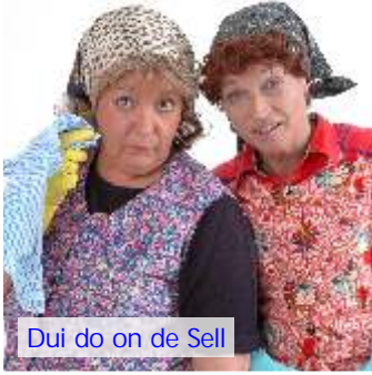
Dui do on de Sell