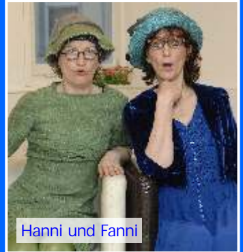
Hanni und Fanni